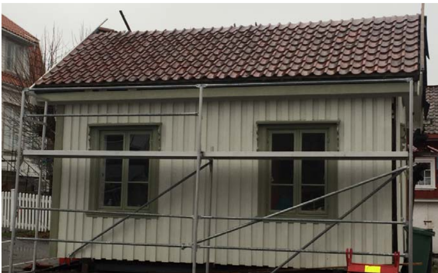
Her er takstein kommet på sørsiden