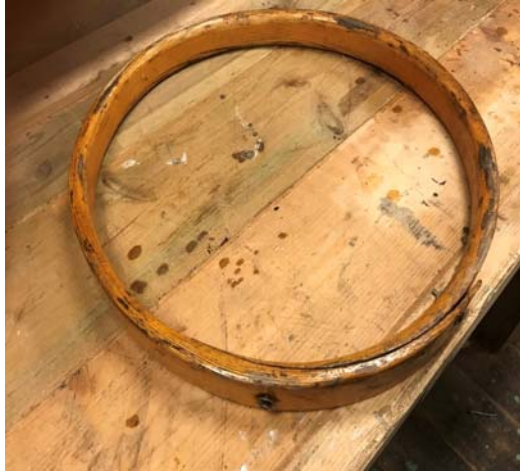
Gammel mastering til RS2