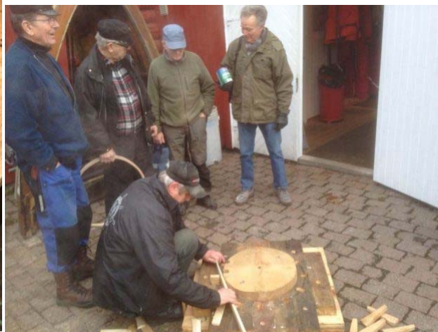
Ny mastering under fabrikasjon