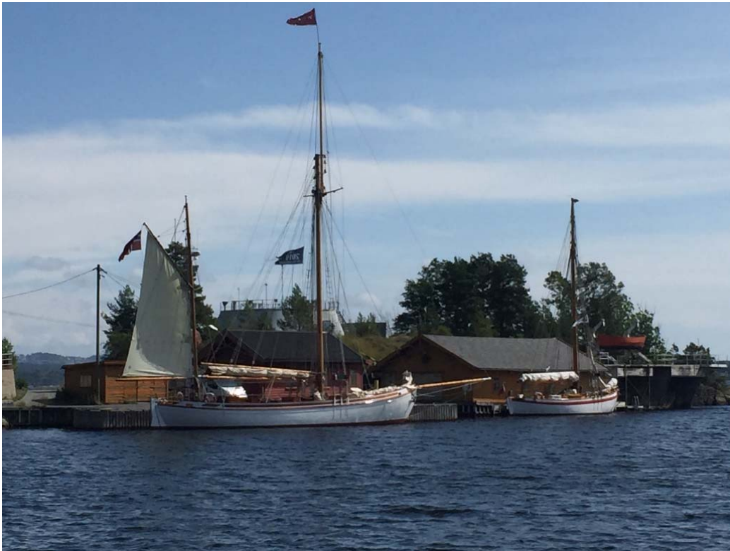
«RS2» og Wyvern ved kai på Croftholmen.

Samtidig som Wyvern var her kom to veteranredningskøyter innom Langesund. Det var «Aril» og «G. Unger Vetlesen». Et hyggelig besøk av venner i veteranredningskøyteklubben.