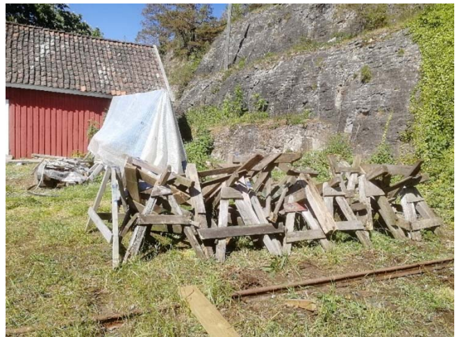
Minner fra «Normandie»? Båtbukker samlet for lagring

Da er alle småbåtene som skal på vannet i år kommet ut. En omfattende innsats er utført med få ressurser.