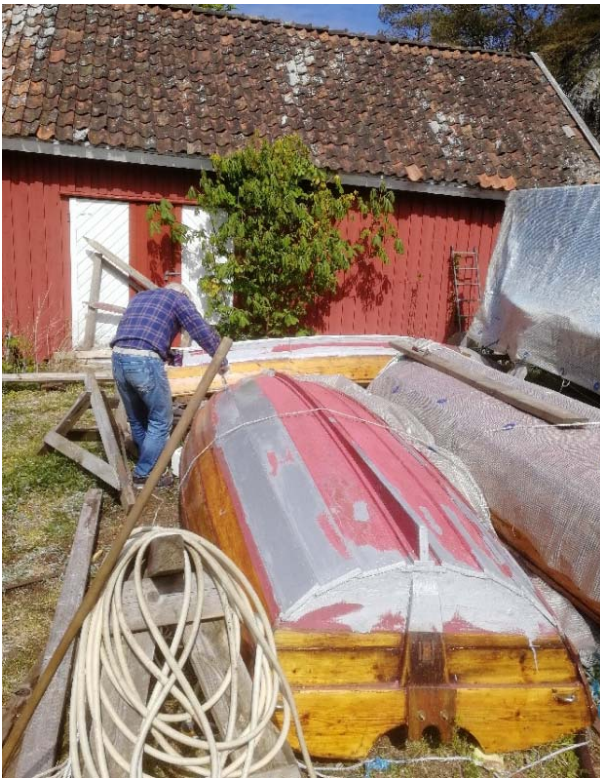
Priming før bunnstoff påføres