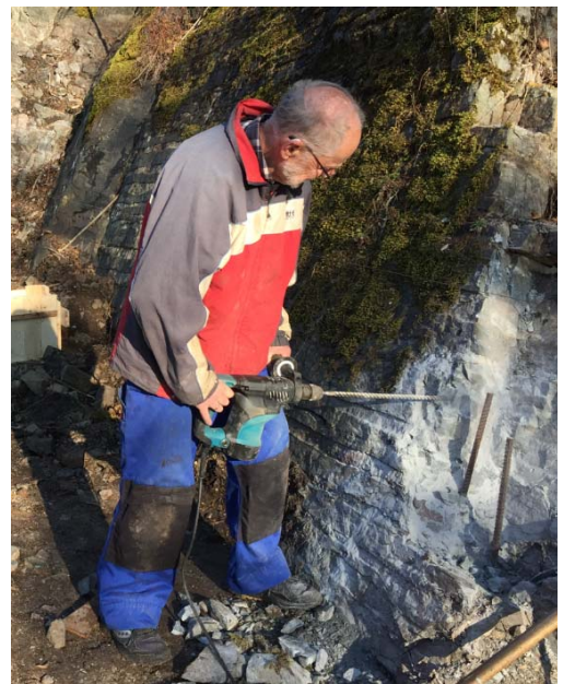
Audun borer hull for festebolter

Det er nå klart for å grave ned vannledningen som henger bortover fjellveggen ned i stien.