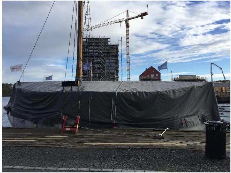
RS2 i vinteropplag med vinterbekledning