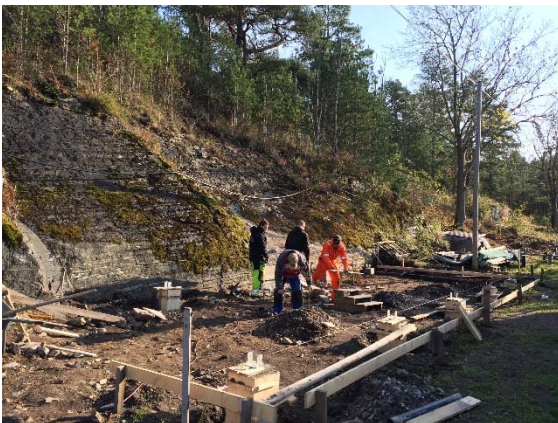
Siste innspurt med støpingen av pilarer